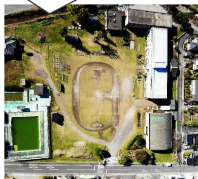
【2025年現在(ドローン撮影!)] (保護者 内村さんより)