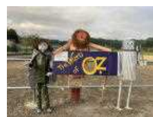
1年生作品【アイデア賞】