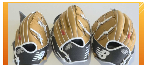
夢を与え勇気づけるシンボルに！