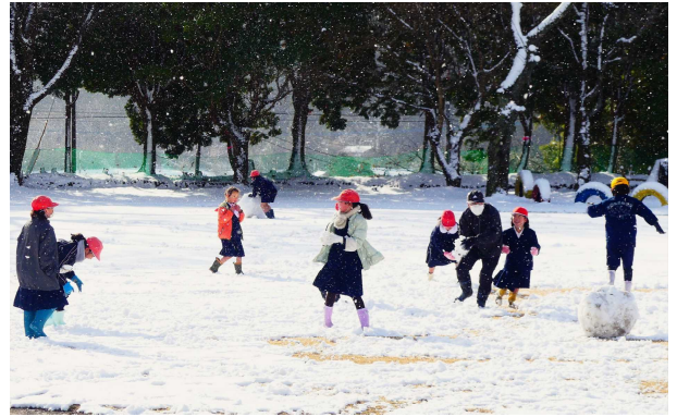
【教児一緒に白熱した雪合戦】

積雪になじみのない鹿児島に住む私たちですが、先日は貴重な体験ができました。1月24日は、強い寒波の影響で九州山間部でも積雪の予報が出され、バスによる登校も心配されましたが、無事に職員・児童共に登校することができました。校庭には辺り一面雪が積もっており、早速、登校した子どもたちは頬を真っ赤にして雪合戦や雪だるま作りをして、つかの間の空からのプレゼントを満喫していました(始良市では山間部の学校のみ)。