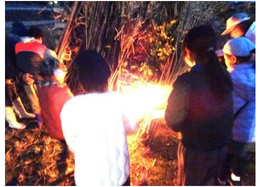
【鬼火焚き（点火）の様子】

9日、令和6年が始まりました。子どもたちは約2週間の冬休みを大きな怪我や病気もなく過ごせ、3学期を迎えることができました。年明け早々の能登半島地震のニュースを見る度に胸が痛む思いをしておりましたが、子どもたちから元気をもらえました。私も漆で初日の出を拝み（3年連続で拝めました）、今年も頑張るぞという気持ちになりました。年頭に当たり、保護者、地域の皆様の御多幸をお祈りすると共に、昨年同様の御支援・御協力を賜りますようお願い申し上げます。