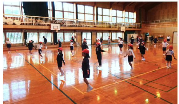
【仲良し体育（縄跳び）】