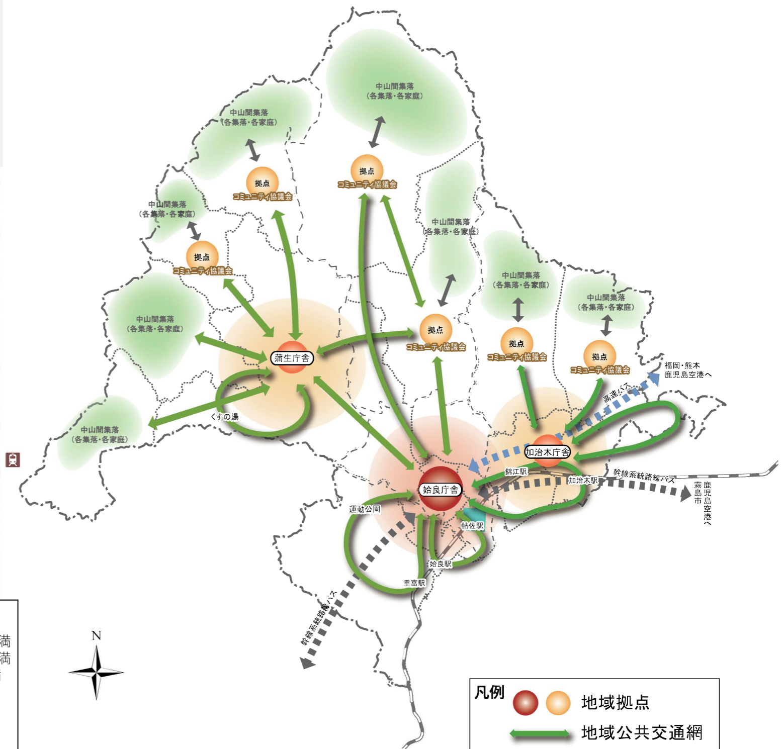
図2 多極ネットワーク型コンパクトシティのイメージ

始良市地域公共交通網形成計画 p 7 を引用 人口総数 (H22)※国土数値情報を基にした、1kmあたりの人口分布