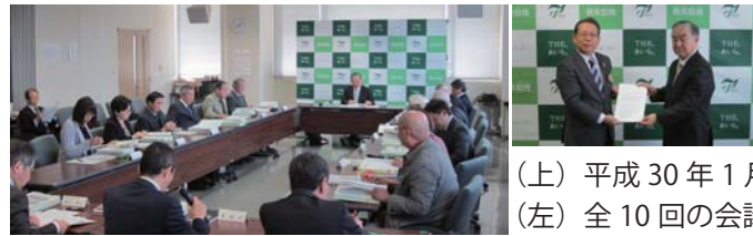
(上) 平成 30 年 1 月の答申 (左) 全 10 回の会議を開催