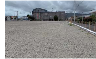
解体後の本館敷地