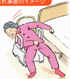
はさまれ事故のイメージ

ご使用中のお客様には大変ご迷惑をおかけいたしますことを深くお詫び申し上げます。何卒ご理解とご協力をお願い申し上げます。