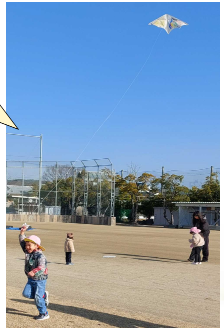
【親子たこあげ大会】

今年のクリスマス会に来てくれたのはじゃんけんサンタさんでした。「ありがとうの黄色いイチョウ」をもらいました。「どこから来たんですか。」「本物?」とサンタさんに興味津々の子供たちでした。