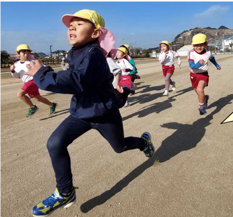
【加治木運動場マラソンごっこ】

加治木運動場で親子たこあげ大会をしました。晴天で少し風もあったので、走ったり、上手に向かい風を使ったりして、親子で一緒にお正月の伝統遊びの一つ、凧揚げを楽しみました。他のお正月遊びも楽しみたいです。