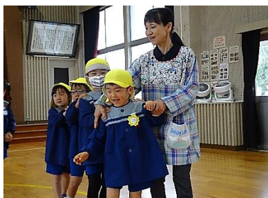
【お世話になった先生方，ありがとうございました。】