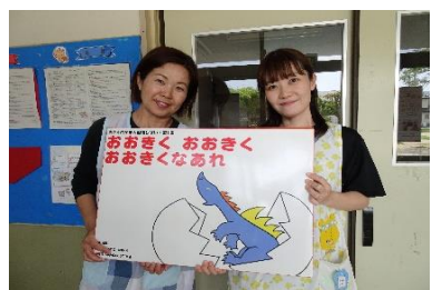
【4月誕生会・読み聞かせ】