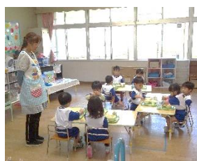
【りす組初めての給食・こあら組牛乳パックの開き方練習】