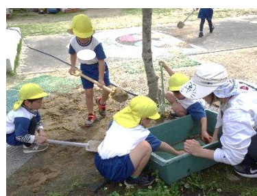
【メダカ水槽そうじ】