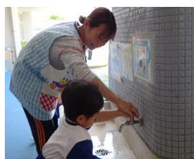
【手洗い楽しく習慣化】