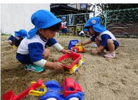
【りす組・園内探検中】