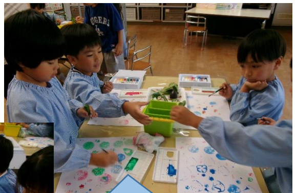
おもしろいかたちだね！