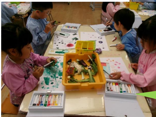
いろをつけると かわいい もようができたね☆