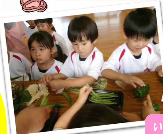
いろいろなお野菜やお肉を さわってみよう！