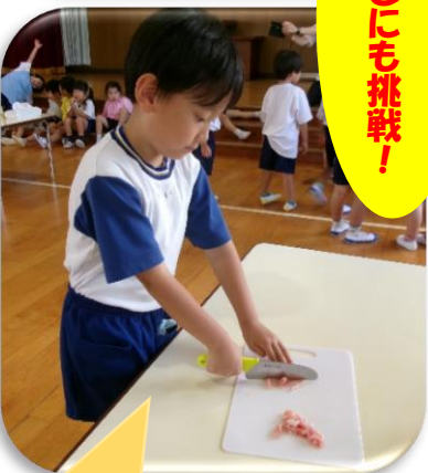
ひとりでもできたよ！