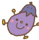
切ったお野菜は スタンプにしたよ！