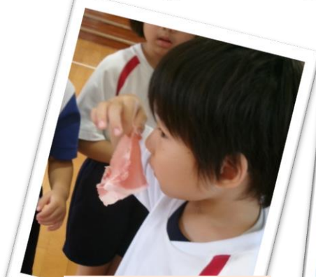
このおにく どんな においがするかな？