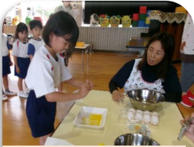
うずらのたまごをわるのは むずかしいなあ…