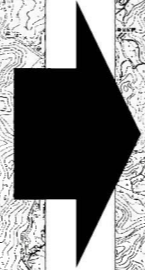
路線図 (工事期間中)