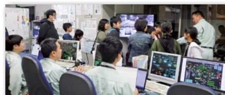
中央制御室の様子