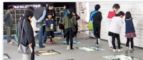
環境問題への危機感を感じとる参加者