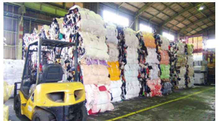
整然と並べられたボール。ボールの重さは約400kg

集められた衣類は、汚れや水分を含んでいないか厳重にチェックされ、約400kgの塊にボール化されます。コンテナに積み込まれた衣類は大型貨物船で海外へ輸送されますが、開封されるまでに長い時間を要するため、少しでも汚れていたり、濡れていた場合、ボール全体にカビが発生し、リユースできない状態になるとのことでした。