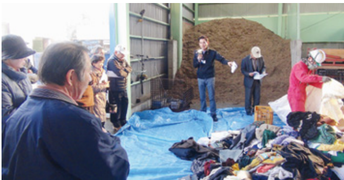
集められた衣類に異物が混入していないかチェック

中間処理では、衣類としてリユースできるものと、リユースできないシャツやカーテン、汚れのひどいものなどが、選別されていました。リユースできないものも、固形燃料の原料として再利用されます。