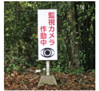
監視カメラ作動中の表示看板

不法投棄は、法律で禁止されている犯罪行為です。また、地域の景観を損なうだけでなく、自然環境や生活環境に大きな影響を与え、見過ごしてしまうと、更なる投棄を誘発します。協会では、不法投棄が多発する場所に監視カメラを設置し、不法投棄防止に努めています。現在、市内7か所に設置しており、不法投棄の抑止に効果を発揮しています。今後も増設や配置換えを継続し、不法投棄の根絶を目指していますので、不法投棄箇所の情報提供や設置へのご理解、ご協力をお願いします。