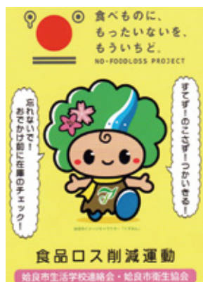
食品ロス削減のステッカー 出前講座などで配布される

家庭でできることを実践し、住みよい地域社会の実現をめざす始良市生活学校連絡会は、「食べられるものが捨てられ、ごみになっている」という現実を見過ごさず、「もったいない、捨てずに残さず使い切ろう」という運動を進めるために新たな事業を展開しました。“くすみん”を使ったステッカーを作成し、出前講座やイベントなどの啓発活動で食品ロス削減の意識付けや呼びかけを行っています。