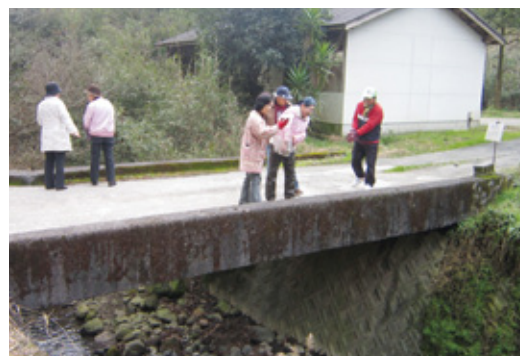
EM団子の投入。 水質浄化が期待される。

EMを活用した環境対策を行っている蒲生生活学校は、EM団子やEM活性液を河川に投入し、水質浄化を図っています。今回の事業では、EM投入前後の水質検査を行い比較するもので、2月にEMを投入した後、同じ流域で水質検査を行い、EMの効果を検証するものです。