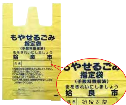
氏名を記入して排出