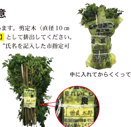
直接、くくりつけて

※直径10cm以上の剪定木は、 可燃ごみ【黄袋】 としては排出できません。1m以内に切断し、「 粗大ごみ 」として排出してください。