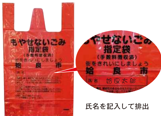
氏名を記入して排出