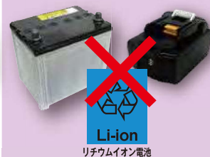
Li-ion リチウムイオン電池

●リチウムイオン電池、バッテリー類は、市では回収しませんので、販売店または、専門業者に依頼し、自ら処分してください。