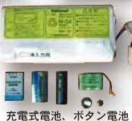
充電式電池、ボタン電池

資源物ステーションには、専用の緑色のコンテナが設置してありますので、分別して入れてください。