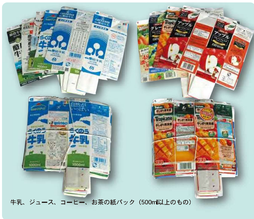
牛乳、ジュース、コーヒー、お茶の紙パック (500ml以上のもの)

ただし、プラスチック製のキャップや中栓は、「その他のプラスチック」として排出してください。