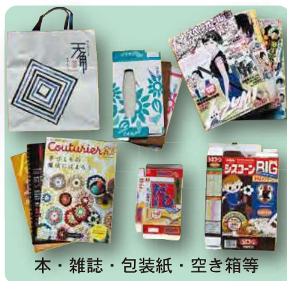
本・雑誌・包装紙・空き箱等