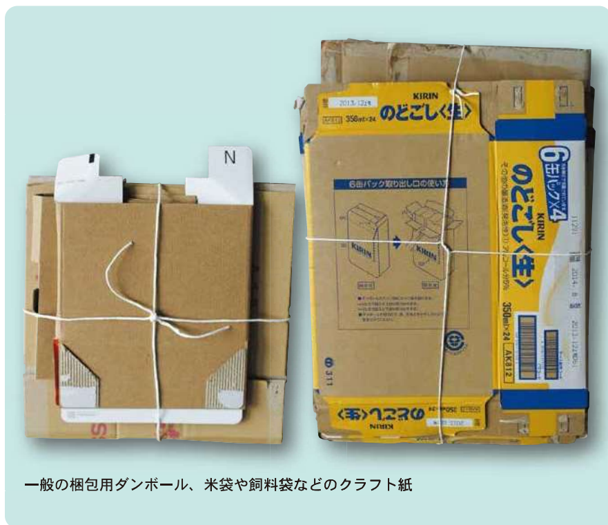
一般の梱包用ダンボール、米袋や飼料袋などのクラフト紙

※ろう紙(ろうを引いた湿った色)のダンボールは「可燃ごみ【黄袋】」として排出してください。