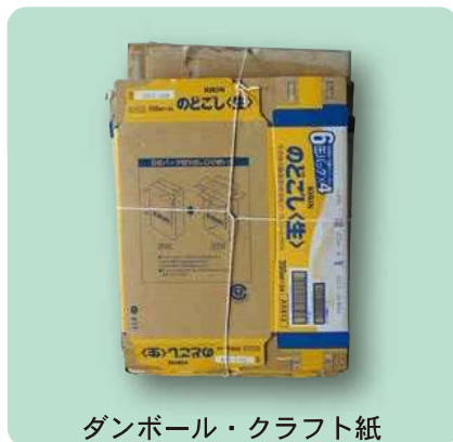
ダンボール・クラフト紙