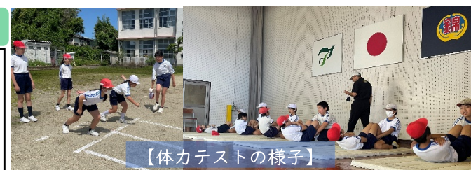
【体力テストの様子】

子どもたちの体力や運動能力の状況を把握し、今後の指導に生かすことを目的として、体力テストを実施しました。自分の体力の現状を知り、運動への関心を高めるとともに、日頃の運動習慣を見直すよい機会となっています。