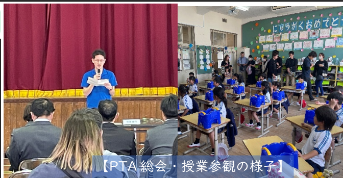
【PTA総会・授業参観の様子】

また、PTA総会では多くの皆様にご参加いただき、今後の教育活動やPTA活動について意見交換を行う有意義な機会となりました。計画・運営にご尽力いただいた皆様、ありがとうございます。