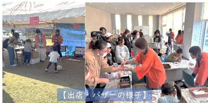
【出店・バザーの様子】

11/16(日)は、第3回にしきえまつりに錦江小 PTA としてバザーや出店で参加しました。当日は、天候にも恵まれ大盛況でした。子どもたちにとって、心に残る楽しい一日となりました。PTA 事業部をはじめ、総務部・おやじ会の皆様には、企画・運営と準備と尽力していただき、ありがとうございました。