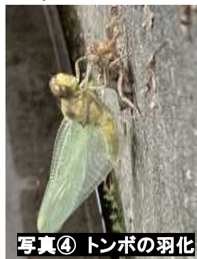
写真④ トンボの羽化

ばたき、飛べるようになり、元気に飛び立っていきました。写真③は、昨年秋に3年生が捕まえたオオカマキリが、虫かごの中に産み付けたたまご(卵しょう)から、5月18日に100匹以上の赤ちゃんカマキリが出てきているところです。テレビの映像でしか観られないような貴重な瞬間を観ることができました。