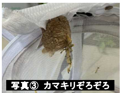
写真③ カマキリぞろぞろ