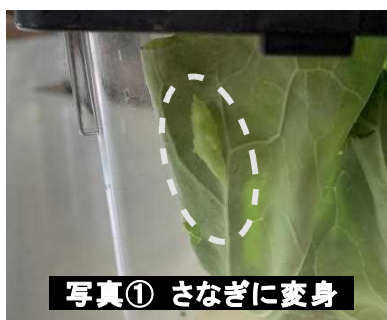
写真① さなぎに変身