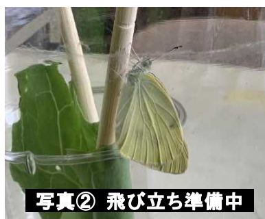
写真② 飛び立ち準備中