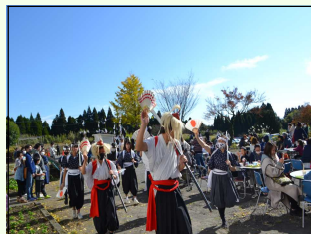
【太鼓踊り・吉左右踊り】