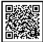
始良市防災メール