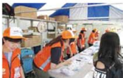
笑顔で来場者を向かえるスタッフ。(茨城国体)

本市でも昨年3月から募集を開始し、現在約90人の登録があり、今月末が締め切りとなりますが、個人