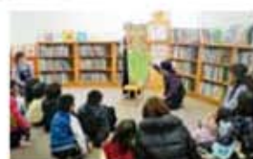
おはなし会の様子

中央図書館 4日・18日(土)午後3時～ 10日(金)午前11時～(おはなしだっこの会)