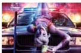
ハーレイ・クインの華麗なる覚醒 Birds of Prey 3/20金