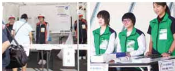
地域の団体や友だち同士で参加する中・高校生。(茨城国体)

や企業や団体での参加受付を実施中です。全国から集まる選手・監督、役員、観戦者などを始良市らしいおもてなしで歓迎し、かごしま国体の成功に向けて一緒に盛り上げましょう。