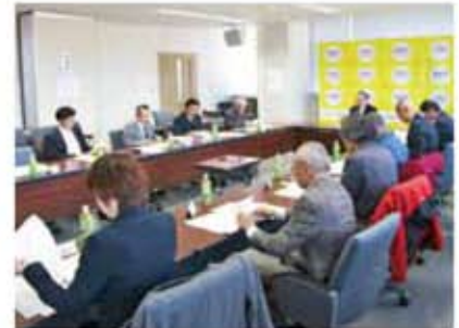
市民ワークショップや地域から集まった声を参考に作成された基本計画の内容など、審議を重ねる委員会。