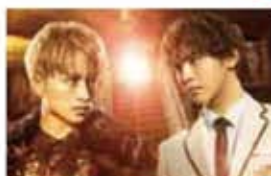
貴族降臨 PRINCE OF LEGEND 3/13金