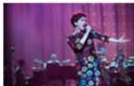
ジュディ 虹の彼方に 3/6金

左下の割引券を劇場窓口にお持ちください。1枚4名様まで有効です。保険証など市民を証明するものもあわせてご持参ください。