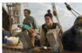
ドクター・ドリトル 3/20金

左下の割引券を劇場窓口にお持ちください。1枚4名様まで有効です。保険証など市民を証明するものもあわせてご持参ください。