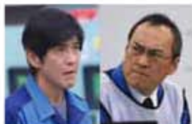
Fukushima 50 3/6金