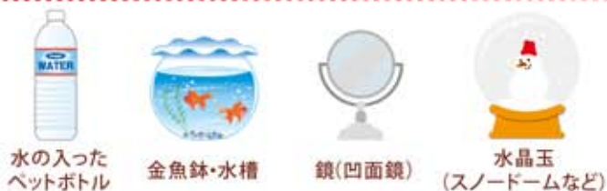
水の入ったペットボトル