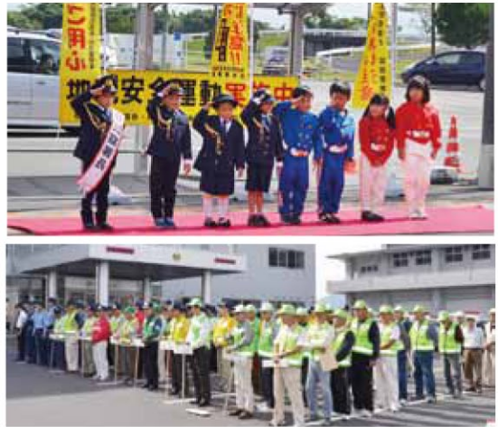
平成 27 年度 全国地域安全運動出発式

10月11日は「安全・安心なまちづくりの日」。毎月11日は「地域安全推進の日」。地域住民、自治体、警察で活動を推進しています。安全・安心なまちづくりに取り組みましょう。