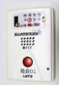
図 始良警察署 ☎ 65・0110

県警では、住民に直接電話をかけて注意を促す「うそ電話詐欺被害防止コールセンター」の開設に続き、自動通話録音警告機「振込め詐欺見張隊」を貸出中（先着順）です。警告機は、電話の呼び出し音が鳴る前に「通話内容を録音します」と相手に案内が流れます。