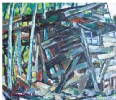
第14回大賞作品「風化」/ 川崎勝己 作