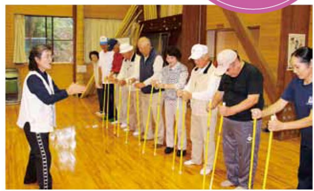
「ニューエルダー元気塾」は、(公財)日本レクリエーション協会が、文部科学省の委託を受け、高齢者の体力づくりを支援する事業として全国展開しています。

9月から、この塾を3回コースで開催しますので、この機会にぜひ参加してみたいはいかがでしょうか。