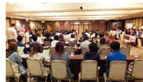
鹿児島県ではプロスポーツだけでなく、大学の合宿誘致活動も盛んに行われている。

大学生の誘致は、経済的な効果だけでなく、SNSなどを巧みに利用したその高い情報発信力が魅力で、大学生が市の情報をインターネット上に拡散(宣伝)する効果に期待しています。