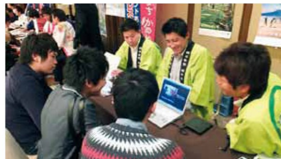
大学生へ市をPRする市職員

大学生を対象とした始良市への誘客PR業務の一環として、昨年「かごしま合宿セミナー」(鹿児島県主催)に参加しています。