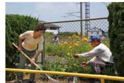
地域を愛する気持ちは、子どもたちにも伝わる。地域住民のみなさんが始良市の魅力そのもの。

5月は市内各中学校で職場体験学習が行われ、それぞれの事業所の業務を生徒たちが体験。このページでは、市のPR業務を学んだ重富中学校3年生2人が、その一環として広報紙編集に携わり、市の魅力を中学生の視点で表現。実際に企画・取材・記事作成・撮影した紙面をご紹介します。