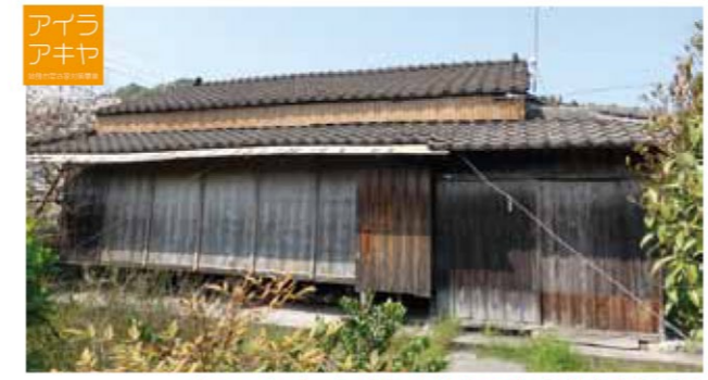
リフォームブームも追い風となっている空き家の需要

市の空き家は、約1800件(H24年度調査)。今後の増加傾向も懸念されていることから、市では活用可能な空き家をできるだけ早く利用へつなげ、また、空き家を生み出さない仕組みづくりのひとつとして、「空き家バンク」を運用しています。