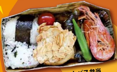
特製あいらフットパス弁当

フットパスのコースを整備することは、まちづくりのきっかけとして全国でも注目され、各地に広まりつつあります。この秋、始良でも県内の市町村に先駆けて、フットパスをはじめます！