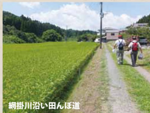
網掛川沿い田んぼ道