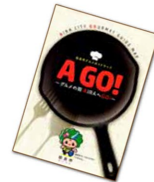
うまいもんフェスタでも、いち早く完売した「あいらんアゴ肉焼」(右)。2月に完成したばかりの市公式のグルメガイド(上)。市内のアゴ肉料理取扱店を含むグルメスポット情報が満載。問合せ:市商工観光課内466-3111 内線283

地域の豊かな気候風土のなかで育った食文化を背景に、現代的感覚を取り入れたストーリー性のあるご当地グルメを開発。食を通じた地域おこしイベントを企画しています。初年度のフェスタでは6万3千人を集客し、市内外に広く始良市をPR。