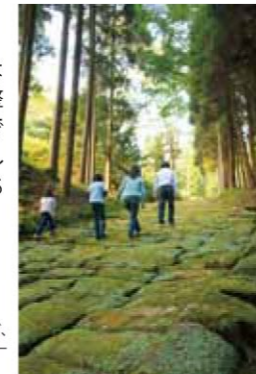
熊野古道に似ているとよく言われるほど、神秘的な景観の龍門司坂。あいらびゅうの観光企画でも人気のスポットだ。

龍門司坂の周辺整備や住吉池公園など、既存スポットに付加価値を付ける整備を進めています。壊して作り直すのではなく、歴史あるものを保全や修復しながら観光資源として本物が光るまちづくりを進めます。