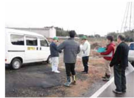
現場をパトロール中の農業委員と市職員

農地は食糧生産に直結し、大切に守っていく必要があることから、農地を違う目的で使うときや売買・賃貸するときには、農地法で一定の規制がかけられています。