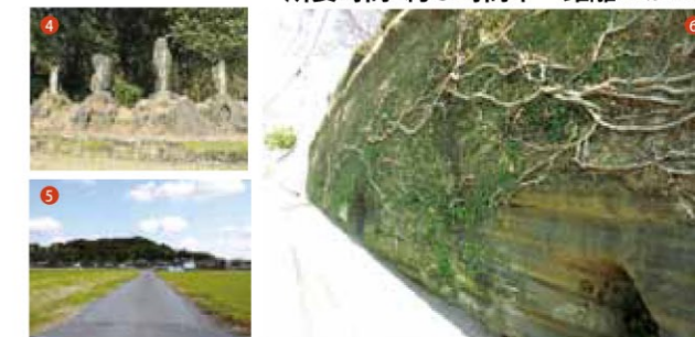
④ 蒲生郷の武士たちが赴いた戦いを物語る記念碑。⑤ 季節によって姿を変える田園風景。⑥ 2つの火口跡の噴火の名残も見られます。