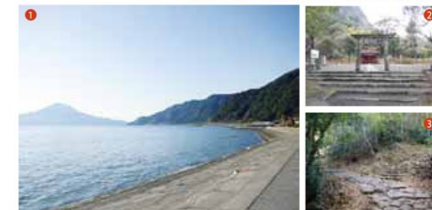
① 潮風薫る公園で錦江湾を望めます。② 島津氏にまつわる逸話を持つ神社。③ 歴史園道・白銀坂で森林浴。