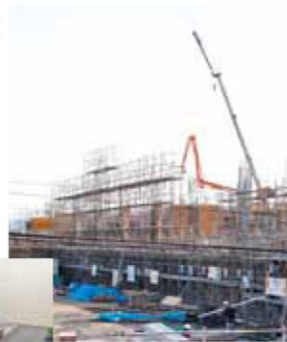
建設が進む松原なぎさ小学校(上)と完成イメージ(左)

重点事業と位置付けている建物が現在建設中です。松原なぎさ小学校は、児童総数が約900人を超え、校舎や敷地が手狭となっている建昌小学校から分離新設されます。