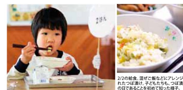
2/2の給食。混ぜご飯などにアレンジされたつぼ漬け。子どもたちも、つぼ漬けの日であることを初めて知った様子。

2月2日の「つぼ漬の日」にちなみ、九州新進(株)(加治木町木田)が「つぼ漬」約160kgを市内全小・中学校へ無償提供しました。鹿児島の食材でつくられたつぼ漬けは、早速、各学校で給食として登場。「カリカリ、おいしい」と子どもたちにも好評。美味しく食べていました。