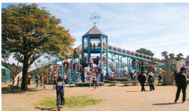
一部遊具を移設した運動公園内の遊具施設「わんぱくひろば」