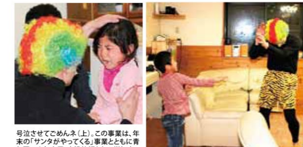
号泣させてごめんネ(上)。この事業は、年末の「サンタがやってくる」事業とともに青年団の人気事業。出欠依頼も年々増加中。

節分の日、始良市青年団の自主事業「おうちに鬼がやってくる」があり、青年団扮する鬼たちが事前に依頼を受けた市内の各家庭に出発。突然の鬼に子どもたちはビックリ。思い出の節分となりました。青年団は、市内在住の若者たちが中心となって地域おこし活動を続けています。