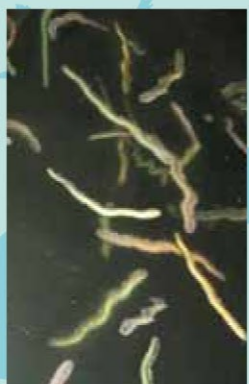
ヤマトカワゴカイ

の世代に命を繋ぐ「生殖群泳」という行動を行う。ゴカイが自然界でどれほど重要な役割を果たしているのか、次世代に命を繋ぐための素晴らしい生きものの知恵、私たち人間とのつながりなど、研究者が直接解説し、実際に一年に一度の命のドラマを目撃するのだ。感動と怖いの見たさのこのエコツアーは、参加した人たちの噂が噂を呼び、今年で10年も続いている。ちなみに、日本国内だけでなく、海外でもこんなおかしな(失礼!)エコツアーは事例がない。まさに、地球でここだけのゴカイのエコツアーは、3月30日~4月1日に今年も行われる。場所は、私たちの始良市。重富海水浴場横の長水路。時間は毎日少しずつ潮の状態に変化するので、予約時に確認してください。詳しいお問い合わせは「NPO法人くすの木自然館」までどうぞ!