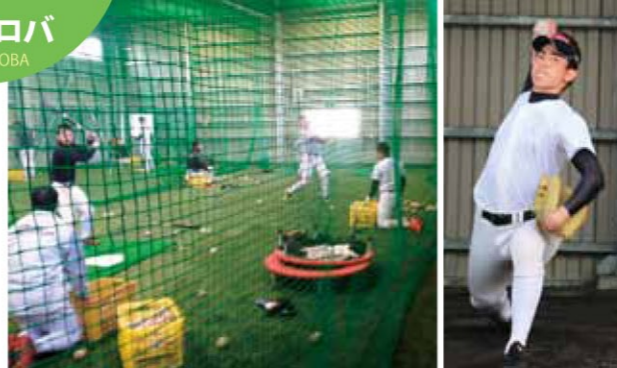
2年ぶりに大学生がキャンピング。来季以降、プロの合宿誘致にも期待したい。

鹿児島スポーツ合宿ガイド(県観光課発行)によると、屋内野球練習場をもつ自治体は鹿児島市、阿久根市、薩摩川内市、日置市、名瀬市。このなかには内野練習に限定された施設もあります。