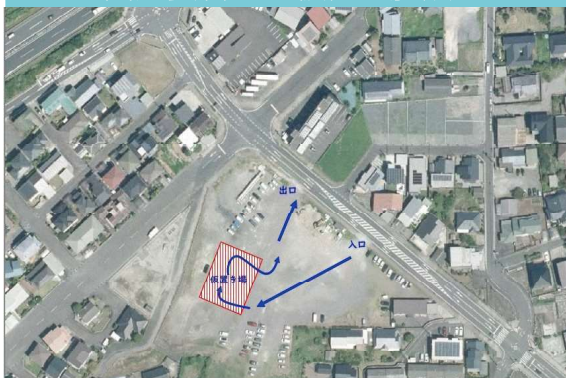
西之妻管理地仮置き施設

令和7年8月の大雨で発生した災害廃棄物は、市への手続きなしで以下の2つの仮置場に直接持ち込むことができます。