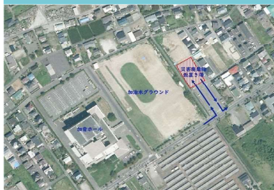
加音ホール・加治木運動場共用駐車場