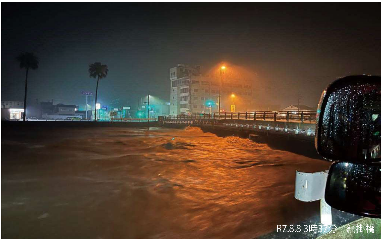
R7.8.8 3時37分 網掛橋