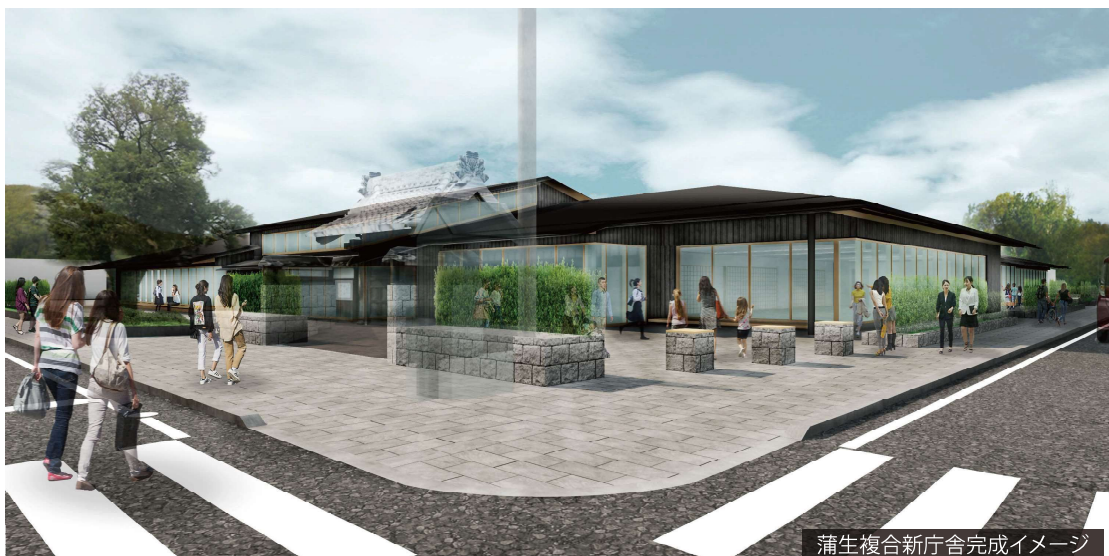
蒲生複合新庁舎完成イメージ

蒲生新庁舎の建設が本格的にスタートしました。新しい庁舎は、鉄骨平屋建てで、役所窓口のほか、図書館や学習室、多目的ホールなどが併設されます。地域の歴史や景観に調和したデザインで、市民に愛される施設になることを期待しています。完成は令和8年3月を予定しています。