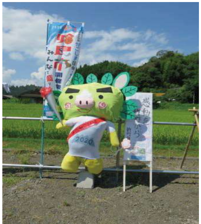
第26回 山田の里かかし祭り大賞「かごしま国体「ぐりぶー」新町自治会」

今年で27回目となる「山田の里・かかし祭り」 今年も、新型コロナウイルスの関係により、ステージや出店などの イベントは中止となりますが、9月1日から10月10日までの期間、山 田団地造成地に、工夫を凝らした「かかし」が展示され、皆様を出 迎えてくれます。 山田校区コミュニティ協議会主催（☎0995・73・7434）。