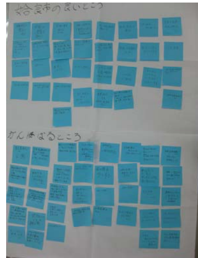
分科会で出された意見