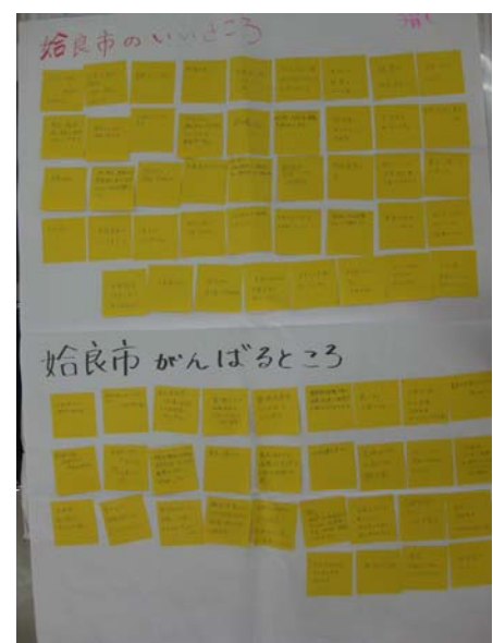
分科会で出された意見