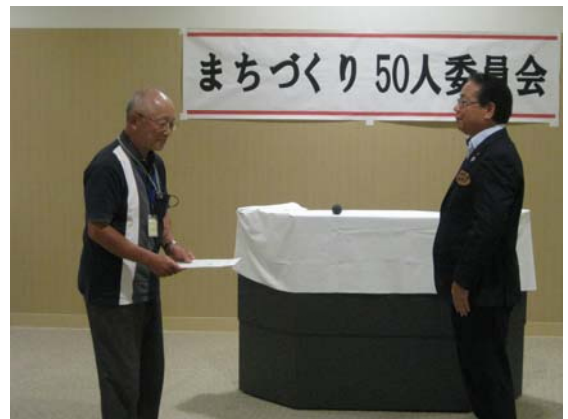
代表委員への辞令交付