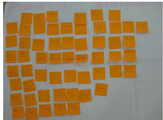
分科会で出された意見