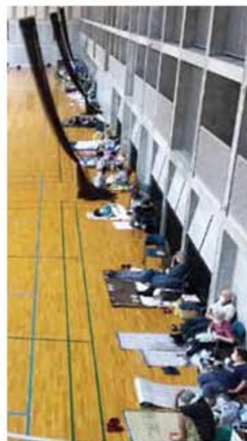
昨年の台風10号の避難者は1,502人。市になってから最多。