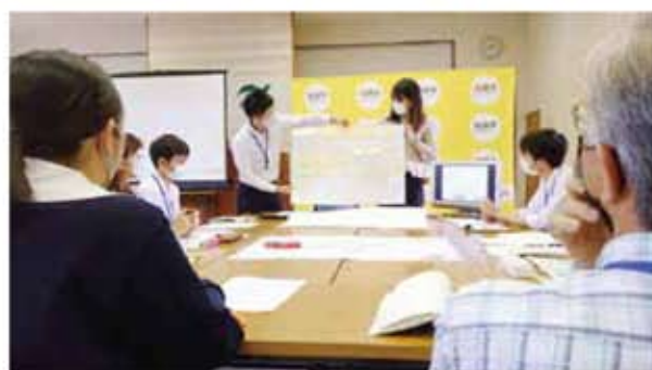
活発な意見が飛び交うワークショップ。蒲生(上)、加治木(下)の各会場の様子

加治木・蒲生両複合新庁舎の設計づくり市民ワークショップが6月から始まっています。今回のワークショップは、平成30年、令和元年に続き、第3期目。「もっと使いたくなる空間をつくろう!」をテーマに、加治木・蒲生の新しい庁舎がより多くの市民のみなさんに利用されるよう10代〜70代の61人のメンバーが参加。設計案