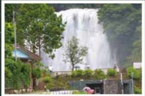
ワンポイント 豪雨のあとの驚きの一瞬を捉えています。

題名 白いカーテン 場所 龍門滝 撮影日 2021/05/16/10:48 データ f/29 1/8 sec. ISO 100 Canon EOS Kiss X10