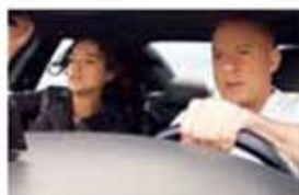
ワイルド・スピード ジェットブレイク