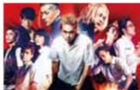
東京リベンジャーズ