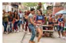
イン・ザ・ハイツ

左下の割引券を劇場窓口にお持ちください。1枚4名様まで有効です。保険証など市民を証明するものもあわせてご持参ください。