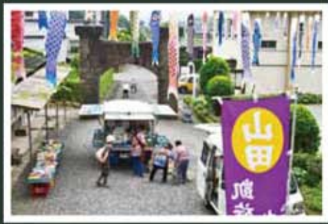
ワンポイント 移動販売車を利用する人々の様子が伺えます。

題名 凱旋門 場所 山田 撮影日 2021/05/11/11:32 データ f/10 1/640 sec. ISO 800 NIKON D750