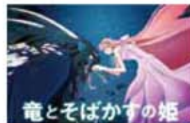
竜とそばかすの姫