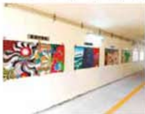
地下通路に飾られる数々の絵に、思わず明るい気持ちになる。

い道もとりあえず足を運んでみると、何かしら新しい発見があるのかもしれないと思わされる体験でした。