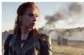
ブラック・ウィドウ

お子さんからご年配の方まで“地元(JIMOTO)”で“映画(MOVIE)”を楽しんでいただくコーナー。シネマサンシャイン始良(イオンタウン始良東街区)に賛同をいただき、市民のみなさん限定の割引クーポンをお付けして毎月旬の主な映画をお知らせします。