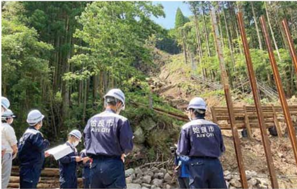
昨年7月の大雨で発生した土砂崩れの現場(加治木町西別府)。災害はいつどこで起こるかわからない。