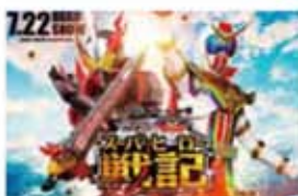
セイバーとゼンカイジャー スーパーヒーロー戦記