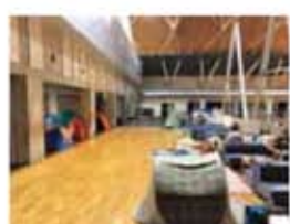
避難所での健康管理 避難所では熱中症やエコノミー症候群を予防するため、水分補給や軽い運動をして過ごすことが大切です。

誰もが不安を抱く避難時には、隣の人に声をかけたり目が合った相手に笑顔を返したりするだけでも大きな安心につながる共助になります。高齢者や子ども、妊婦、障がいをもつ人などへは特に配慮が必要。