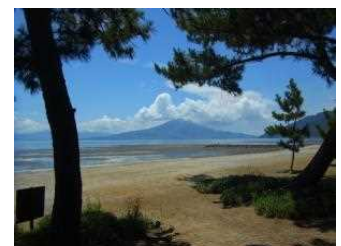
白砂青松の重富海岸

(私は年度末に北山の「スターランドAIRA」に行きました。目的の土星・木星は見られませんでした。白鳥座の二重星アルビレオをはじめ、ダイヤモンドのように輝く星々を見ることができ、宇宙の神秘に思いをはせました。)