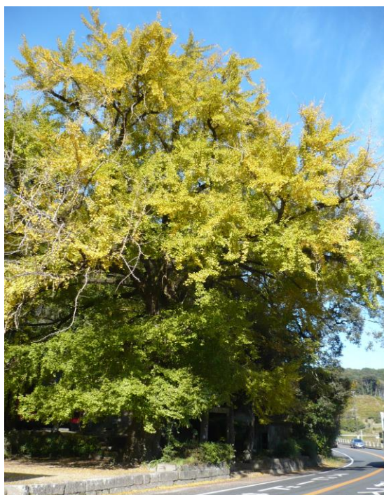
大山祇神社 銀杏 十一月二十一日