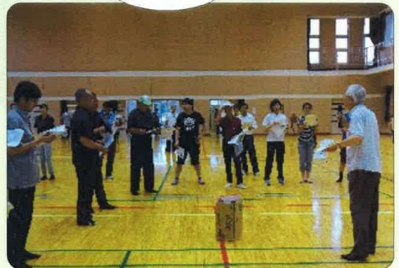
GPS認知症徘徊感知機器「i t s u m o」の説明 グループ意見交換