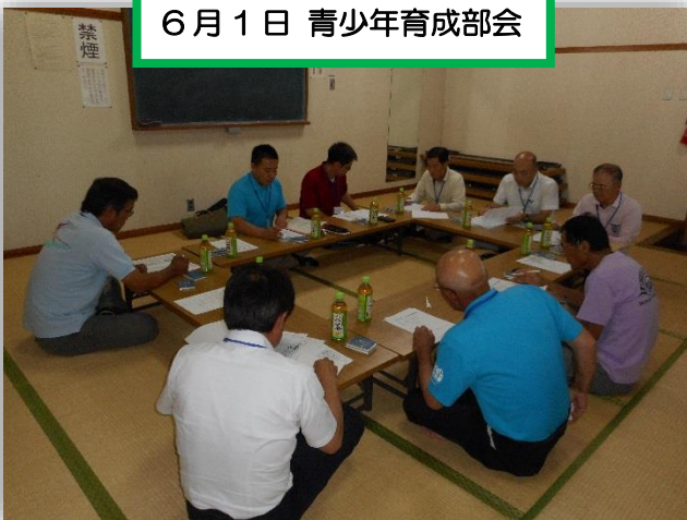
6月1日 青少年育成部会