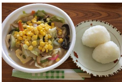
じっくり煮込んで出汁をとった 野菜たっぷりちゃんぽん