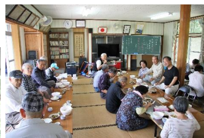
にぎやかにお食事中