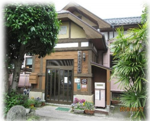
加治木図書館(国登録有形文化財)

柁城校区まちづくりプラン4頁の 加治木図書館(国登録文化財)の写 真を右の写真に差し替えてください。