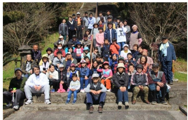
じゃんけん大会後の記念撮影