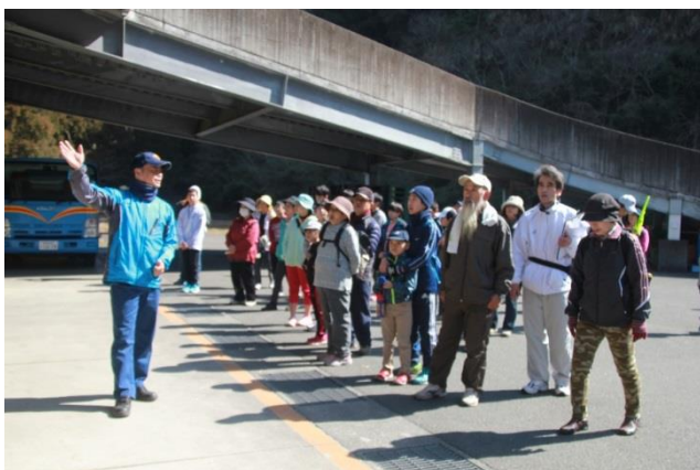
リサイクルセンターで説明を受けました