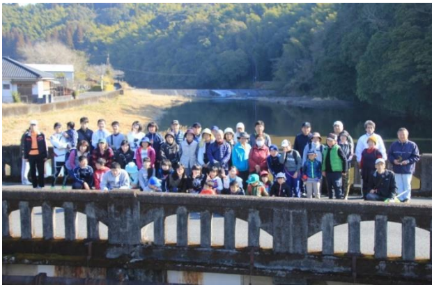
山田橋の上でパチリ♪

来年も、もちろん開催します!! どなたでも参加できますので、ぜひお越しください!