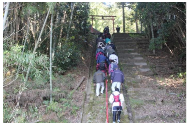
貴船神社への階段はたくさんでした