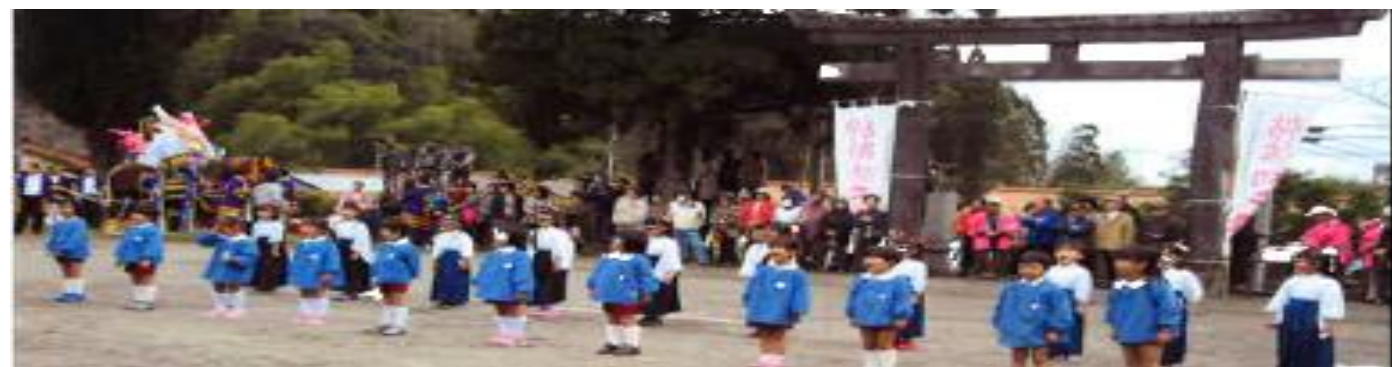
初めて出演した「帖佐幼稚園」のみなさん