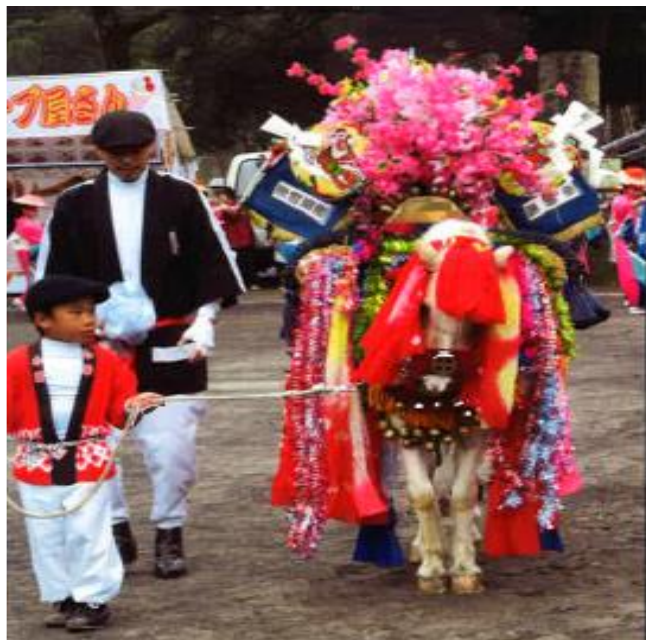
帖佐十九日馬踊り 平成28年3月6日