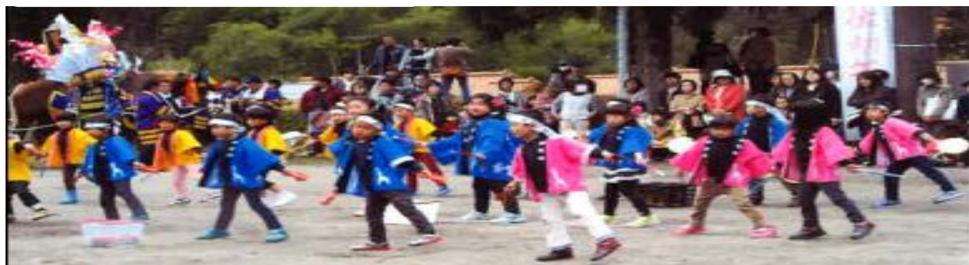
初めて出演した「帖佐保育所」のみなさん