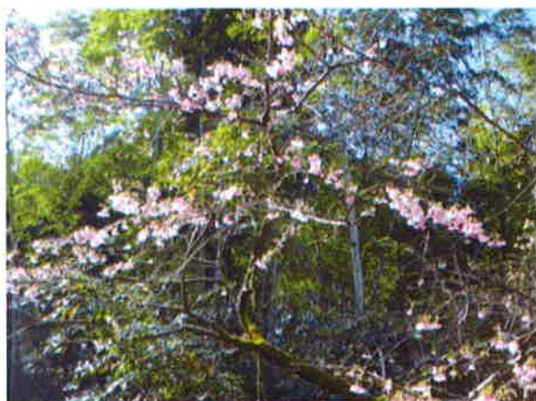
1月に満開の桜(西浦下)