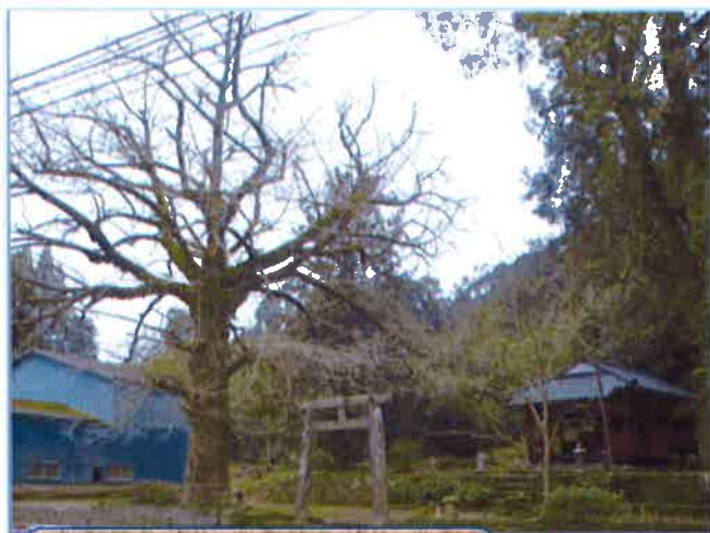
落葉した大山穂神社の银杏