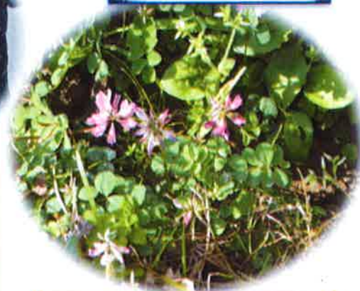
1月に、れんげが・・・(井ヶ屋)