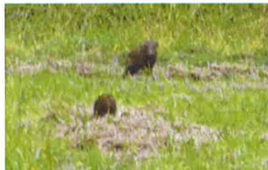
田んぼに出て来た猪