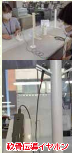
軟骨伝導イヤホン

答 対象者には、すぐに隣に寄り添い、筆談等でも対応している。先進地の事例を調査・研究を進めていきたい。