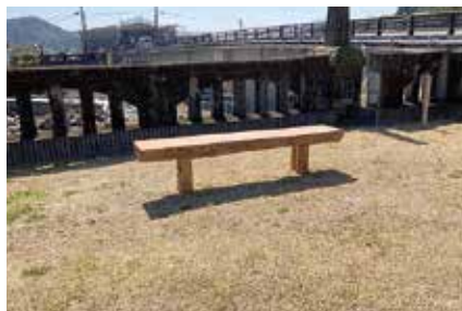
ベンチが整備された山田川パーク