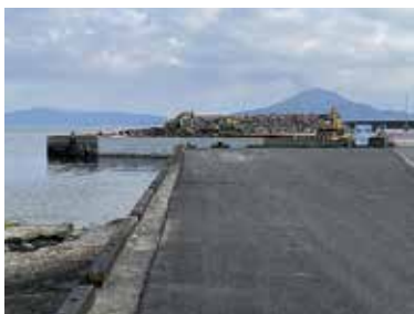
整備が必要な加治木港

しかし、国防・安全保障等については国が処理を担任しているため、他自治体等からの避難者の受入れについての計画の策定等は行われていない。