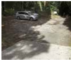
市道から20メートル「トイレ設置可能な場所」

答 鹿児島市において、上下水道の整備がされていない場所で、維持管理等の観点も含め、トイレ設置は困難であるとの判断に至ったものと認識している。