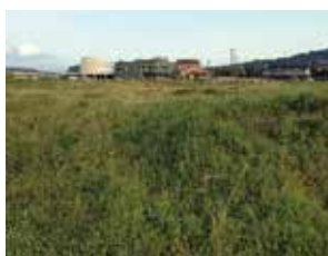
人口増対策で取得された下久徳の住宅用地

今後も目的に沿った活用を基本的に社会情勢や地域の状況等を精査しながら進めていく。