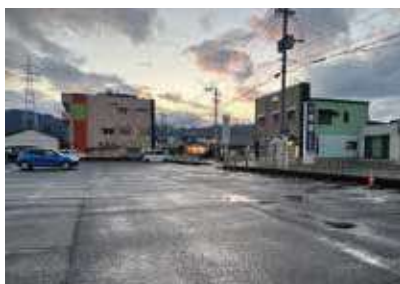
本庁舎2号館前の駐車場

答 近年、目的外の不法駐車が常態化していたが、注意喚起を行ったものの改善が見られなかった。夜間の騒音やゴミの散乱などが慢性化しつつあったことや、現在は新庁舎建設で駐車スペースが減っていることから、来庁者に十分な駐車スペースを確保するためにやむを得ず閉鎖した。