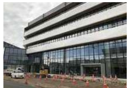
完成間近となった本庁舎

瑕疵クレームについては市と設計業者双方で協議し引き渡しを受けるので発注者側の責任である。