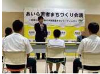
あいら若者まちづくり会議

令和6年度からの「始良市公式LINE」による情報発信は評価できる一方で、リンク先となるホームページの充実が必要である。