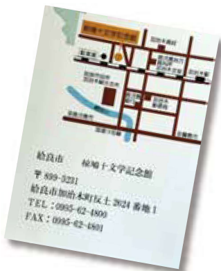
棕鳩十文学記念館

答 長野県の喬木村は、棕先生が生まれ育った場所で、そこに建つ喬木村立棕鳩十記念館との交流は、両館で行われるイベントの案内通知による情報共有を行ったり、企画展開催時などでは相互に発行している刊行物のやり取りを行ったりしている。