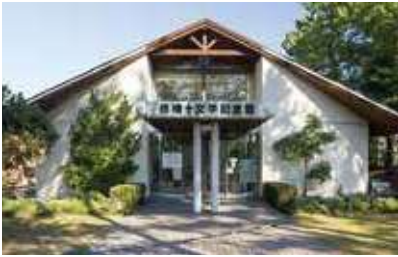
椋鳩十文学記念館

● 椋鳩十文学記念館の利用者数が停滞している。文化芸術のさらなる振興を図るためにも、より一層の有効活用と利用促進に努めること。