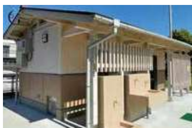
永池公園のトイレ

● 道路の維持管理のための人員体制の再構築や人材育成、併せて道路維持管理状況のデジタル化やデータベース化の推進。