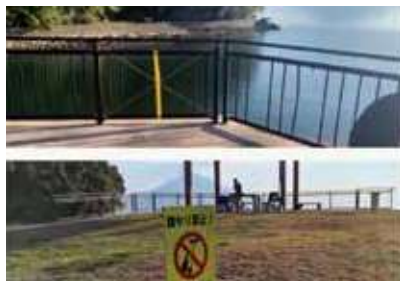
美しい景観を守りたい

答 動物基金や愛護団体・獣医師会等の関係団体等と協議を行い、意識啓発を図っていきたい。