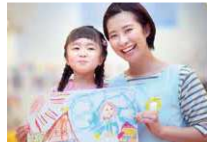
▲保育士の負担軽減を

本市において、独自の配置基準や補助は、現在のところ考えていないが、子どもたちが安全・安心に過ごす保育施設の環境整備や保育士の処遇改善、業務負担軽減等に関する補助事業の活用を事業者に求めていく。