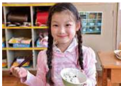
▲子どもたちのために

答 無償化については、現時点では市独自で実施する考えはないが、国の動向を注視し、交付金を活用した保護者の負担軽減策を検討したい。