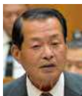
国生 卓 志成会