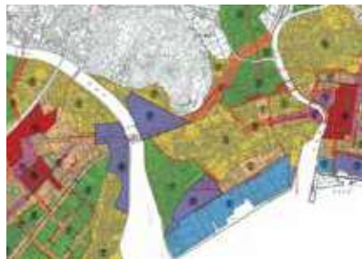
駐車場不足の始良・加治木地区の商業地

駐車場不足に対応するための市営駐車場の設置計画はない。今後、商工会等との協議の場を持ち、研究していく。