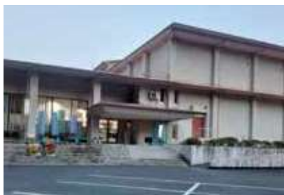
蒲生公民館は今後も適切に維持管理される

答 地域住民の活用に資するためには、直営方式の方が利用しやすいと考える。また、土日の午後5時以降の開館は、前日までの利用申請で対応される。