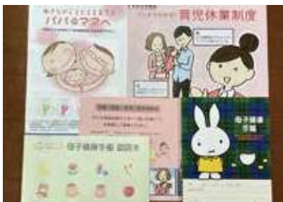
母子健康手帳と子育てガイド

答 母子健康手帳の交付時に子育てガイド等を活用し、妊娠中の過ごし方や育児方法を学ぶ場として、個別に実施している。家事、育児を男女が共に担う課題として、今後も男性の育児休業の取得促進に向け、市民や企業への周知広報に努める。