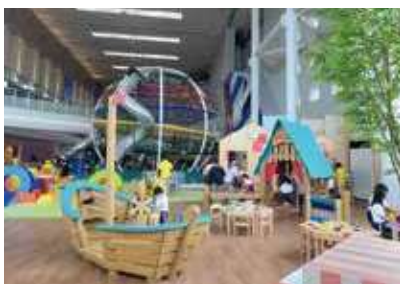
ボートレース芦屋内の全天候型遊具施設