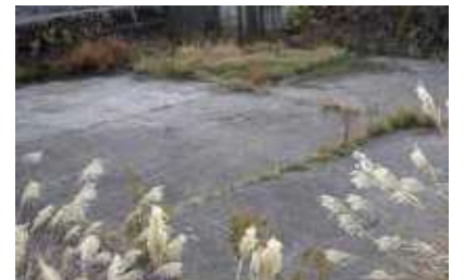
土砂や雑草根っこごと撤出が望まれる沈砂池

答 令和5年3月に職員で雑草除去を実施し、令和6年3月までに、土砂や雑草の除去を予定している。