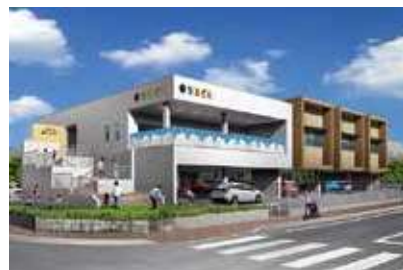
子ども館完成予想図

また、保護者の心理的・身体的な負担の軽減及び解消を行う「一時預かり事業」は、保育士の配置を含め円滑に事業を行う必要があるため、業務委託を予定している。人員体制は、館長等を含め15人程度とする。