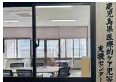
鹿児島県医療的ケア児等支援センター

答 鹿児島県医療的ケア児等支援センターや地元病院との情報共有のほか、市内の事業所に所属する医療的ケア児等コーディネーターをメンバーとした「医療的ケア児等グループ会議」を昨年度立ち上げ、市内関係事業所等との連携に努めている。その中で、医療的ケア児が利用できる医療型短期入所サービスの不足との意見がある。「緊急時の利用」「介護者の負担軽減」いわゆるレスパイトケア等が課題である。