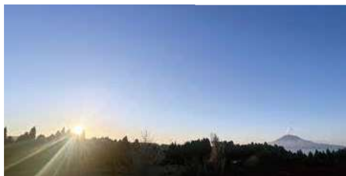
永原小学校から見た初日の出