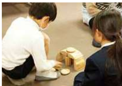
森林環境譲与税を活用した木育教室

答 新庁舎建設における木材利用や「木とふれあう木育推進事業」において木材を加工して製作した玩具・書棚等を市内保育所・幼稚園等の子育て支援施設に給付するなど市民の理解が深まるように努める。