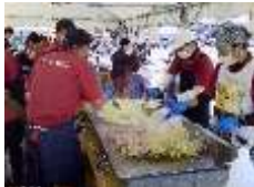
【大人気の親睦やきそばともぐらたたき】