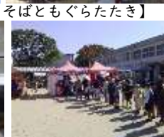
【外部出店も大行列】

【お礼】バザーに際し、柁城校区コミュニティ協議会から「二万円」、PTA親睦委員会OBから「一万円」の寄付をいただきました。大変ありがとうございました。