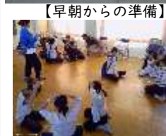
【コミュニティ協議会柁城加タ】