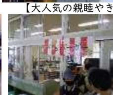
【恒例の柁城バーガー】