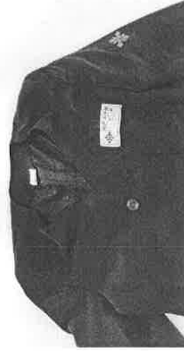
図1 ブレザー：校章とネームをぬいつける。