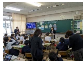
【5年1組の授業の様子】

本校では、「一人一人が主体的に学び、学んだことを豊かに表現できる子供の育成～個別最適・協働的な学びにおける効果的なICT機器の活用を通して～」のテーマのもと、研究を行ってきました。本研究では、「個別最適な学び・協働的な学びは目標を達成するうえで効果的であったか」「ICT機器は効果的に活用できたか」を視点を捉えました。そして、上・下学年ブロックに分かれ、事前研究等を積み重ねてきました。さらに、ワークショップ型の研究会をもとに、日常の授業改善を進めてきました。学習課題の提示や指導方法の在り方、学習形態や板書・発問の工夫、ICTの有効活用などの指導法の研究を深め、子供が生き生きと学習できる手立てを講ずることによって、「主体的」に学びが深まってきています。今回の成果を生かし、残された課題に向かって今後とも努力をしていきたいと思ひます。