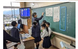
【3年3組の授業の様子】