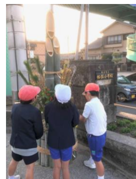
門松に見入る子どもたち

日本の伝統文化に触れ、そこに込められた願いにまで思いを馳せる。そんな冬休みを過ごしてほしいと思います。