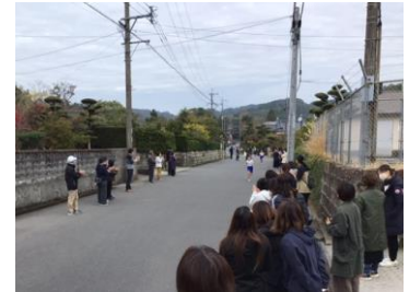
子どもたちの力走にたくさんの応援をいただき、ありがとうございました。 (12月10日校内持久走大会)

今日、お子さんが持ち帰った通知表には2学期の成果がたくさん詰まっています。めくりながら、大いに認め励ましてくださるよう、お願いします。