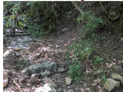
⑬土砂崩れによる石畳埋没