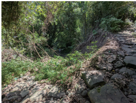
⑫土砂崩れによる石畳埋没