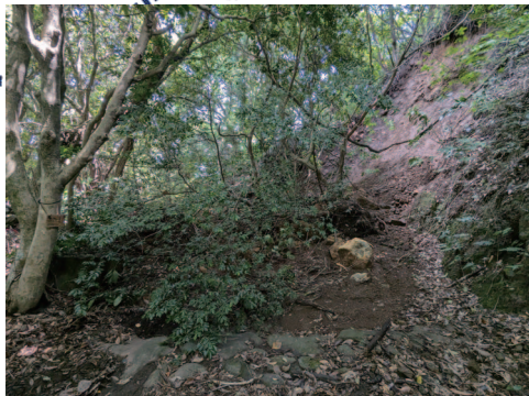
⑪土砂崩れによる石畳埋没