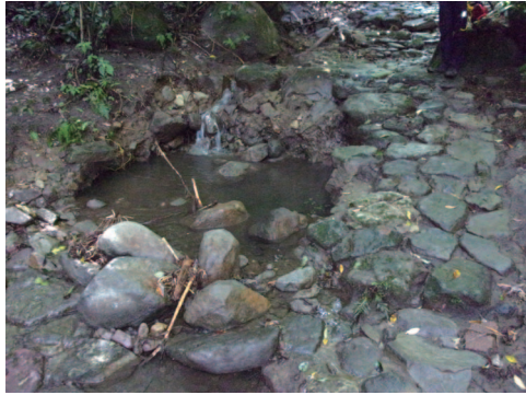
⑧石畳流失 布引の滝