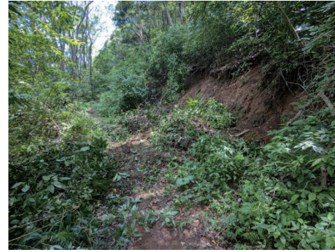
⑩土砂崩れによる石畳埋没