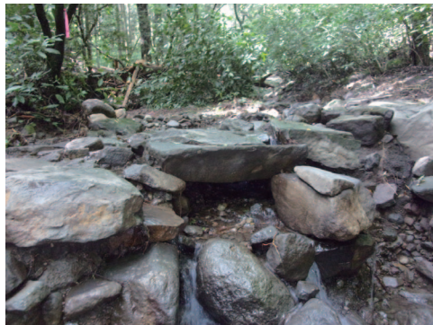
④石橋付近の土石堆積