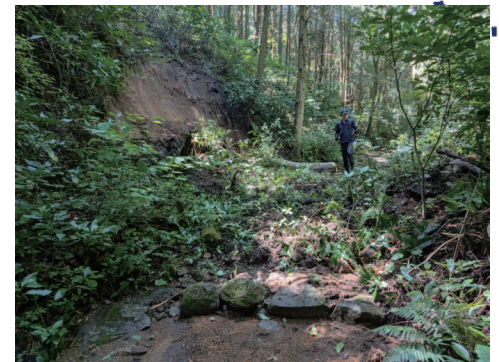
⑦土砂崩れによる石畳埋没