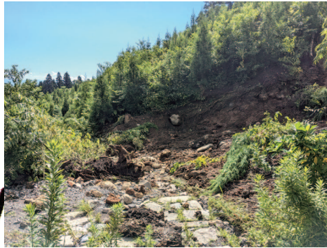
①土砂崩れによる石畳埋没