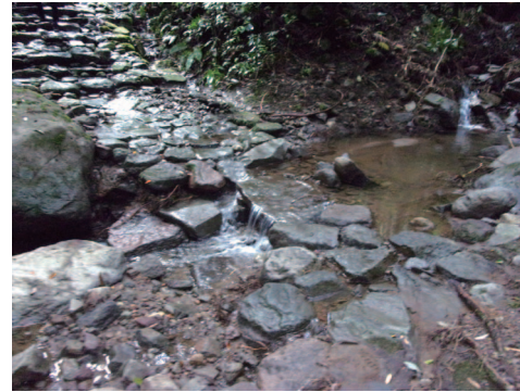
②石橋付近の土石堆積