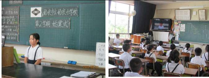
【オンラインでの始業式】

各家庭でも検温等感染予防に取り組んでいただき、ありがとうございます。今後も子どもたちが下校後や休日も感染予防の意識をもって過ごせるようご協力をお願いいたします。